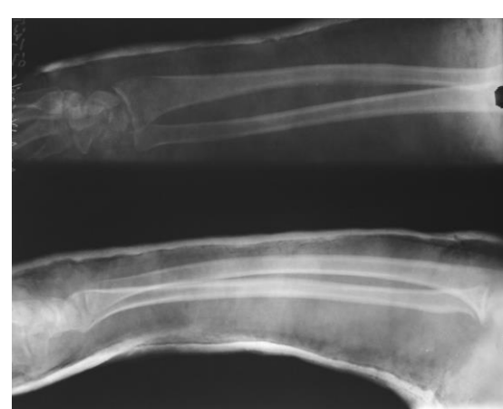
عکس‌های شماره ۲