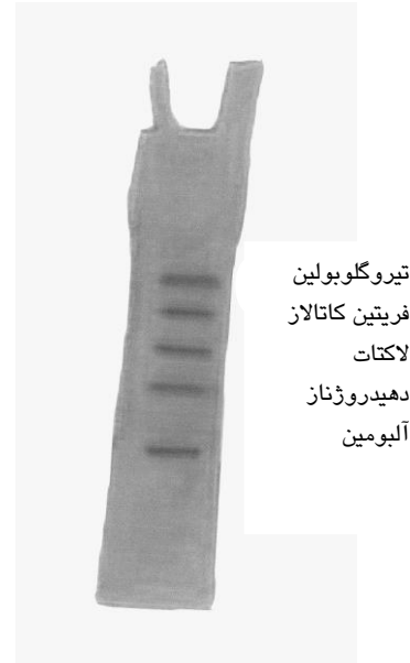
شکل ۱: استاندارد پروتئین به روی ژل PAGE با شیب غلظت ۱۶-۲٪