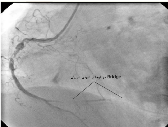
تصویر شماره ۴

همچنین شریان قدامی چپ تنگی شدید در قسمت میانی همراه با درگیری قسمت ابتدایی اولین شریان دیاگونال داشت (تصویر شماره ۲). شریان سیرکمفلکس چپ نیز در قسمت میانی تنگی شدید داشت (تصویر شماره ۲) و جریان خون به انتهای هر دو شریان قدامی چپ و سیرکمفلکس TIMI 3 بود. سپس شریان کرونر راست با کاتتر جادکینز راست مشاهده شد. تنگی طولانی شدید قسمت میانی RCA با لخته و بی‌نظمی (Complex Stenosis Irregularity) مشاهده شد (تصویر شماره ۳) که شریان TIMI3 داشت. در قسمت میانی شریان PDA که از انتهای شریان کرونر راست جدا می‌شد، قطع کامل جریان خون در سیستول بطنی و باز شدن کامل رگ در دیاستول بطنی مشاهده گردید (تصویر شماره ۳)، این پدیده در ابتدا و انتهای شریان PLV که از انتهای شریان کرونر راست جدا می‌شود، همزمان دیده شد (تصویر شماره ۳ و ۴). تشخیص بیماری تنگی شریان اصلی چپ (LM) با تنگی شدید هر سه رگ کرونر، Multiple Myocardial Bridge در انتهای RCA بود.