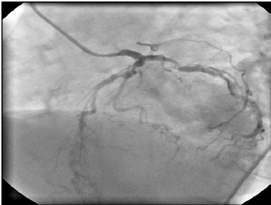
تصویر شماره ۲