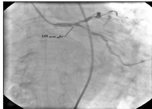
تصویر شماره ۱