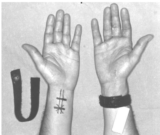
تصویر شماره ۱- محل نقطه مریدین پریکاردیوم ۶ و طریقه صحیح بستن مچ بند طب فشاری