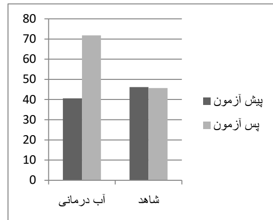
نمودار شماره ۱- عملکرد بیماران قبل و بعد از تمرین

نتایج تحقیق حاضر با نتایج تحقیقات سیلوا و همکاران (۱۵)، گرین و همکاران (۱۶) و هینمن و همکاران (۱۳) که بیانگر اثربخشی معنی‌دار آب‌درمانی بر عملکرد عینی و ذهنی بیماران مبتلا به استئوآرتریت بودند، همخوانی دارد. همچنین یافته‌های تحقیق با نتایج حاصل از تحقیق یلفانی و همکاران (۱۰)، لاند و همکاران (۱۷)، فولی و همکاران (۱۱) نیز همسو بوده و با تحقیق وانگ و همکاران (۱۸) ناهمسو می‌باشد. نتایج نشان داده است که برنامه تمرینی ورزش در آب سبب بهبود عملکرد حرکتی در زنان سالمند مبتلا به استئوآرتریت زانو می‌شود که نتایج مطالعات لیم و همکاران (۱۹)، وانگ و همکاران (۲۰) و بارتلز و همکاران (۲۱) را تأیید می‌نماید. بررسی‌های صورت گرفته نشان داده‌اند که تمرین درمانی در آب می‌تواند اختلالات فیزیولوژیکی همراه با استئوآرتریت چون ضعف عضلانی، حس عمقی، تعادل، آمادگی قلبی عروقی و محدودیت دامنه حرکتی مفصل را بهبود بخشد. دیگر مزایای بالقوه تمرین درمانی برای این گروه از بیماران، بهبود تحرک، وضعیت روانی، ناهنجاری‌های متابولیکی و کاهش خطر سقوط و کاهش وزن بدنی است. یافته‌های تحقیق حاضر حاکی از آن است که آب‌درمانی بر کیفیت زندگی فیزیکی بیماران مبتلا به استئوآرتریت مفصل زانو تأثیر معنی‌داری دارند. علاوه بر این، نتایج حاکی از آن بود که برنامه تمرینی ورزش در آب سبب بهبود کیفیت زندگی در زنان مبتلا به استئوآرتریت زانو می‌شود که با نتایج مطالعات لیم و همکاران (۱۹)، وانگ و همکاران (۲۰) و بارتلز و همکاران (۲۱) مشابه می‌باشد.