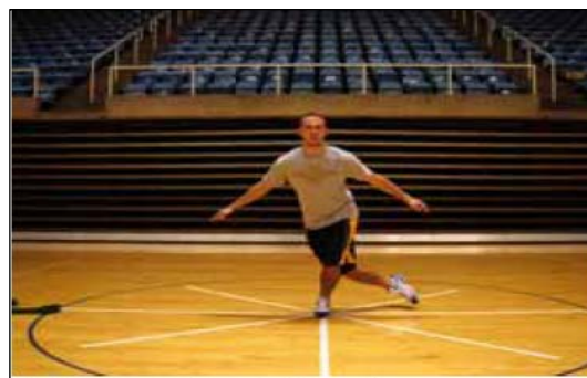
الف: حال تعادل در جهت خارجی