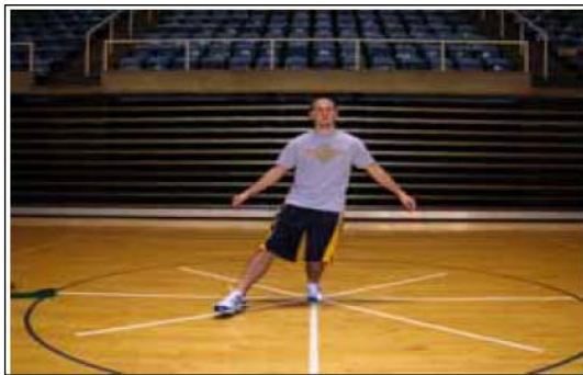
ب: حالت تعادل در جهت قدامی - داخلی

داوطلبین به مدت ۵ دقیقه مرحله گرم کردن (دوی نرم و آهسته) را انجام دادند و سپس عضلات همسترینگ، چهار سر ران، عضلات سرینی، دوقلو، نعلی، فلکسورهای ران را به مدت ۵ دقیقه تحت کشش قرار دادند. پس از مرحله گرم کردن آزمودنی در مرکز ستاره قرار می‌گرفت، روی پای برتر می‌ایستاد و با پای غیر برتر در جهتی که آزمونگر انتخاب می‌کرد عمل دستیابی حداکثری را بدون خطا انجام می‌داد و به