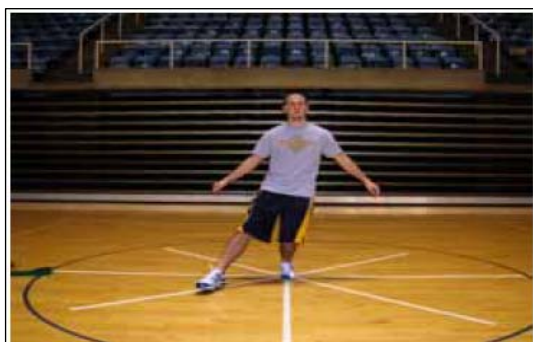
ب: حالت تعادل در جهت قدامی - داخلی

داوطلبین به مدت ۵ دقیقه مرحله گرم کردن (دوی نرم و آهسته) را انجام دادند و سپس عضلات همسترینگ، چهار سر ران، عضلات سرینی، دوقلو، نعلی، فلکسورهای ران را به مدت ۵ دقیقه تحت کشش قرار دادند. پس از مرحله گرم کردن آزمودنی در مرکز ستاره قرار می‌گرفت، روی پای برتر می‌ایستاد و با پای غیر برتر در جهتی که آزمونگر انتخاب می‌کرد عمل دستیابی حداکثری را بدون خطا انجام می‌داد و به