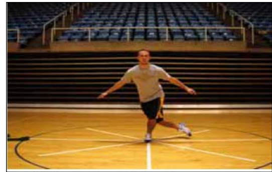
الف: حال تعادل در جهت خارجی