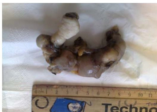
شکل ۲- لوله فالوپ سمت چپ خارج شده