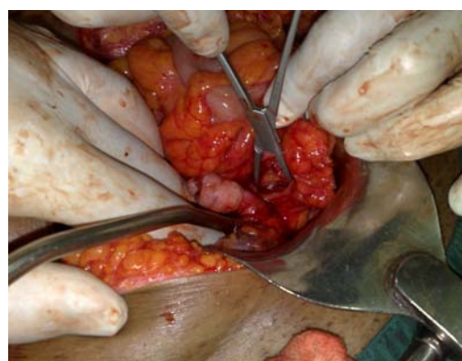
شکل ۱- تخمدان و لوله فالوپ در لومن رکتوم

بیمار با توده رکتوسیگموئید تحت عمل جراحی قرار گرفت. جراحی لاپاراتومی با برش خط وسط (low midline incision) انجام شد. چسبندگی شدید روده وجود داشت که برطرف شد. تخمدان و لوله رحمی سمت راست از دیوار رکتوسیگموئید در درون مجرای مقعد دیده می‌شد (شکل ۱).